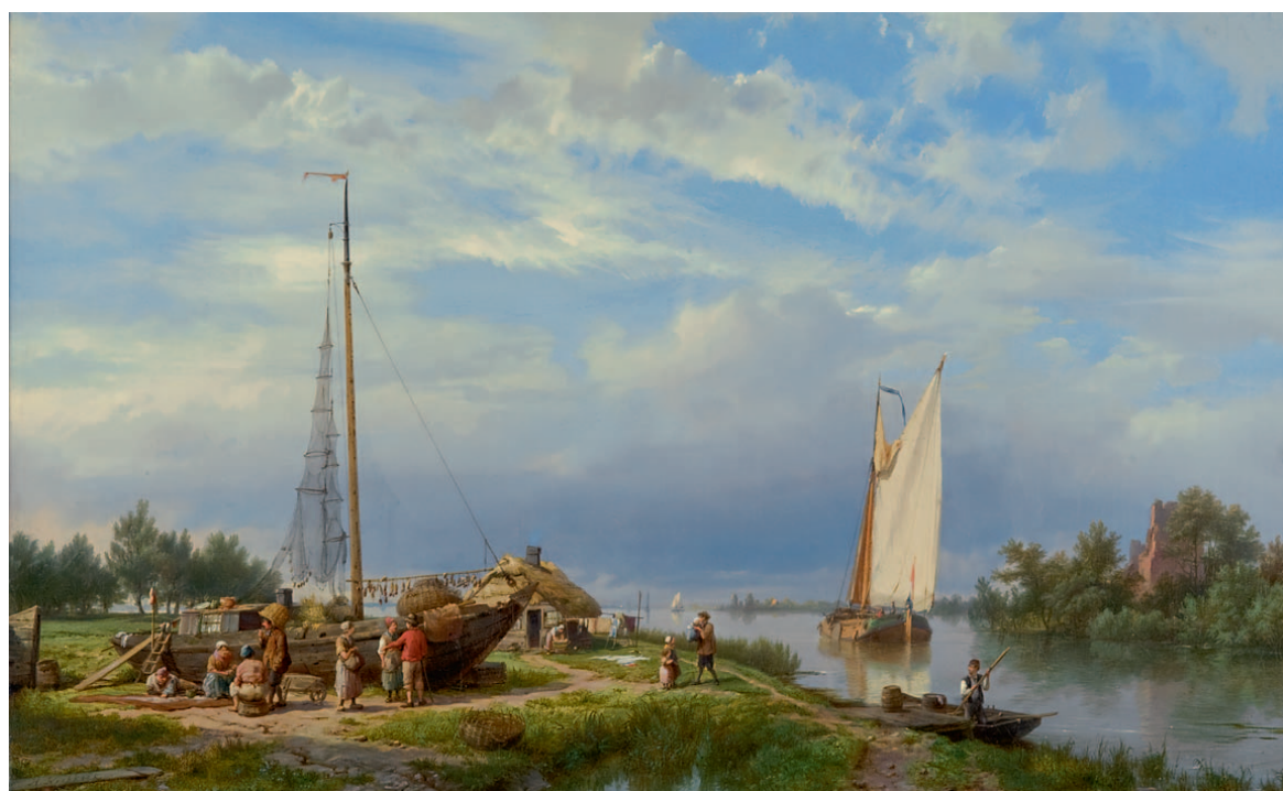
Hermanus Koekoek Langs de rivier op een zomerse dag

'Karsen verkoopt vaak moeilijk, omdat zijn stadsgezichten meestal gefantaseerd zijn. Maar, ik stond niet zo lang geleden op de heuvel waar Karsen dit schilderde en het klopte.'