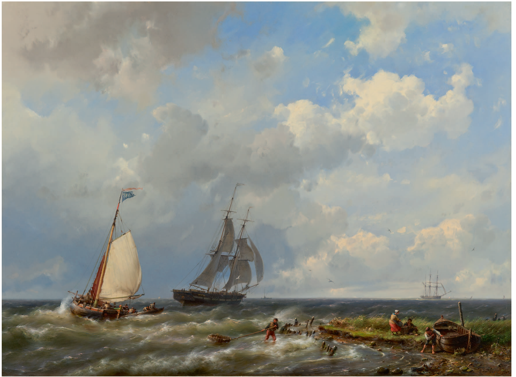
Hermanus Koekkoek Zeilschepen voor de kust

Middelburg 1803-1862 Kleef (Duitsland) Opkomend noodweer , paneel 65,5 x 83,7 cm, gesigineerd en gedateerd 1843. Herkomst: coll. M. van Becelaer, 1848; kunst- handel Olthoff, Den Haag; kunsthandel Herinx, Brunssum, ca. 1938; H.J.G. Kreyen, Kerkrade; coll. P.D. Ketellappers, Brussel/Opicina (Italië), 1981; part. bezit Italië. Lit.: Kunstchronijk , 1848, pag. 78 (verslag tent. Levende Meesters 1848); F. Gorissen, B.C. Koekkoek 1803-1862. Werkverzeichnis der Gemälde , Düsseldorf 1962, cat.nr. 48/66 (met afb., foutief gedateerd 1848); tent.cat. Kleef, Städtisches Museum Haus Koekkoek, B.C. Koekkoek 1803-1862: das malerische Werk , 1962, cat.nr. 61; tent.cat. Antwerpen, Guillaume Campo, 75 jaar Campo , 1972, cat.nr. 509; Weltkunst , 1973, pag. 2006. Tent.: Amsterdam, Tentoonstelling van Levende Meesters , 1848, nr. 167; Brussel, Tentoonstelling van Levende Meesters , 1848, nr. 511; Kleef, Duitsland, Städtisches Museum Haus Koekkoek, B.C. Koekkoek 1803-1862: das malerische Werk , juni-sept. 1962; Antwerpen, België, Guillaume Campo, 75 jaar Campo , okt.-nov. 1972; Kleef, Duitsland, Museum B.C. Koekkoek- Haus, B.C. Koekkoek - Im Kreis der Romantik , april-sept. 2012.