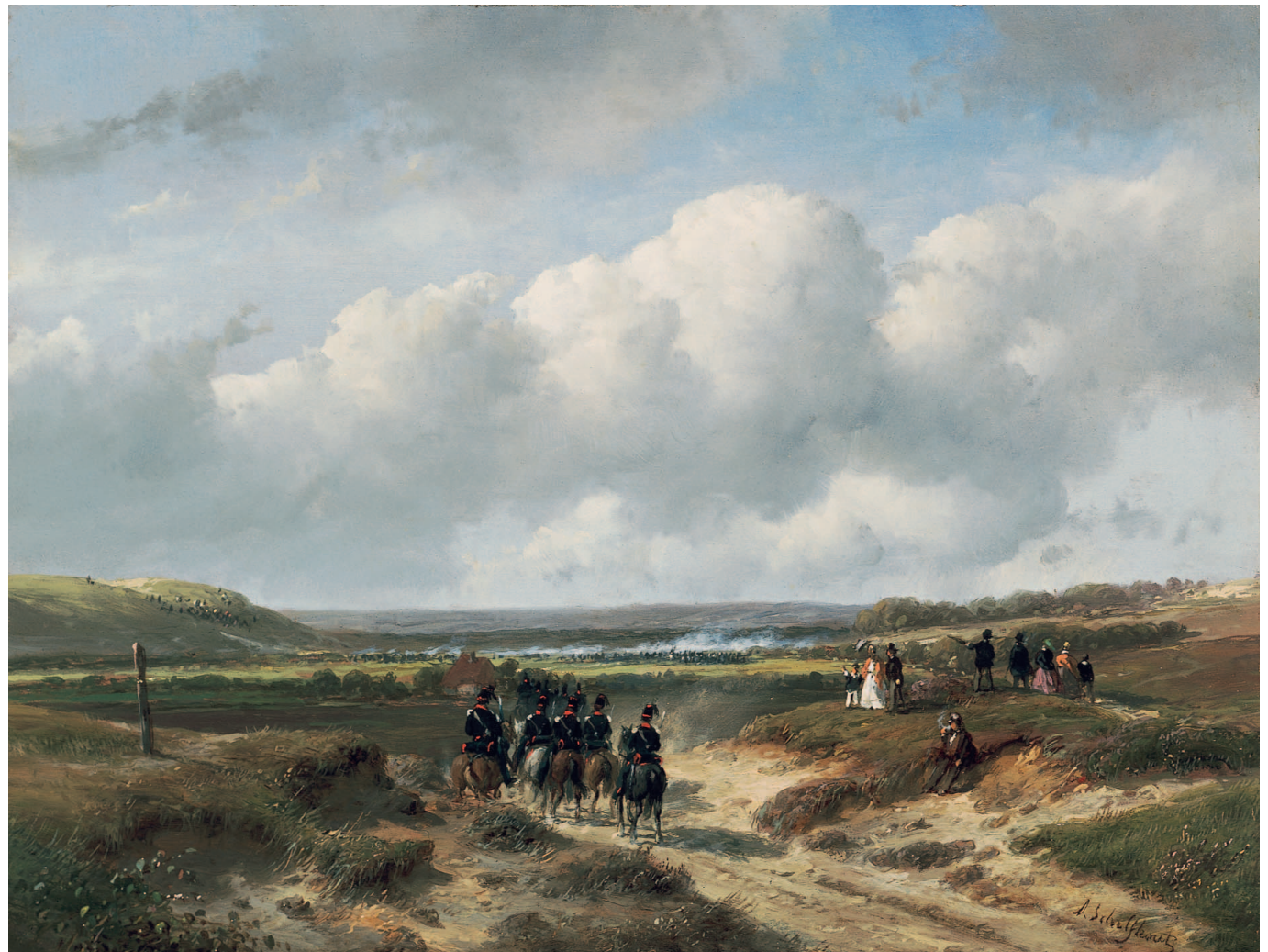
Andreas 'Andries' Schelfhout Manoeuvres van het Haagse garnizoen op de Waalsdorpervlakte