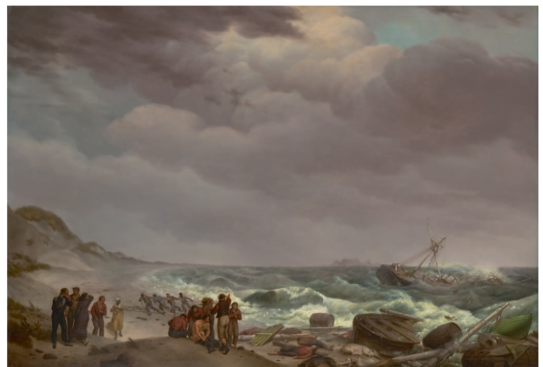
Johannes Hermanus Koekoek De schipbreuk

'Een schijnbaar onverkoopbaar schilderij vanwege het grote aantal drenkelingen, maar er is ongetwijfeld iemand die er net zoveel van houdt als ik. Échte romantiek!'