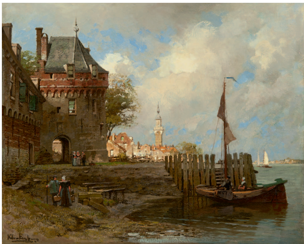
Johannes Christiaan Karel Klinkenberg De Campveerse toren te Veere