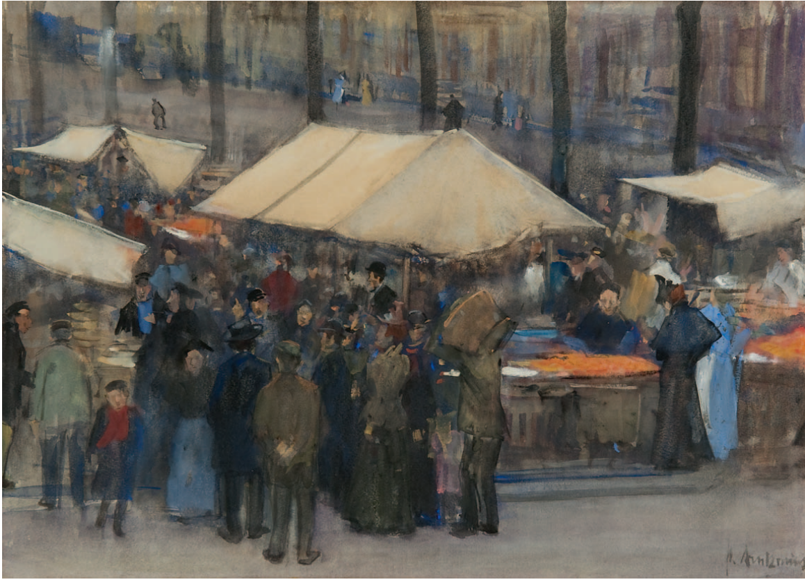
Pieter Florentius Nicolaas Jacobus 'Floris' Arntzenius Markt op de Prinsengracht in Den Haag