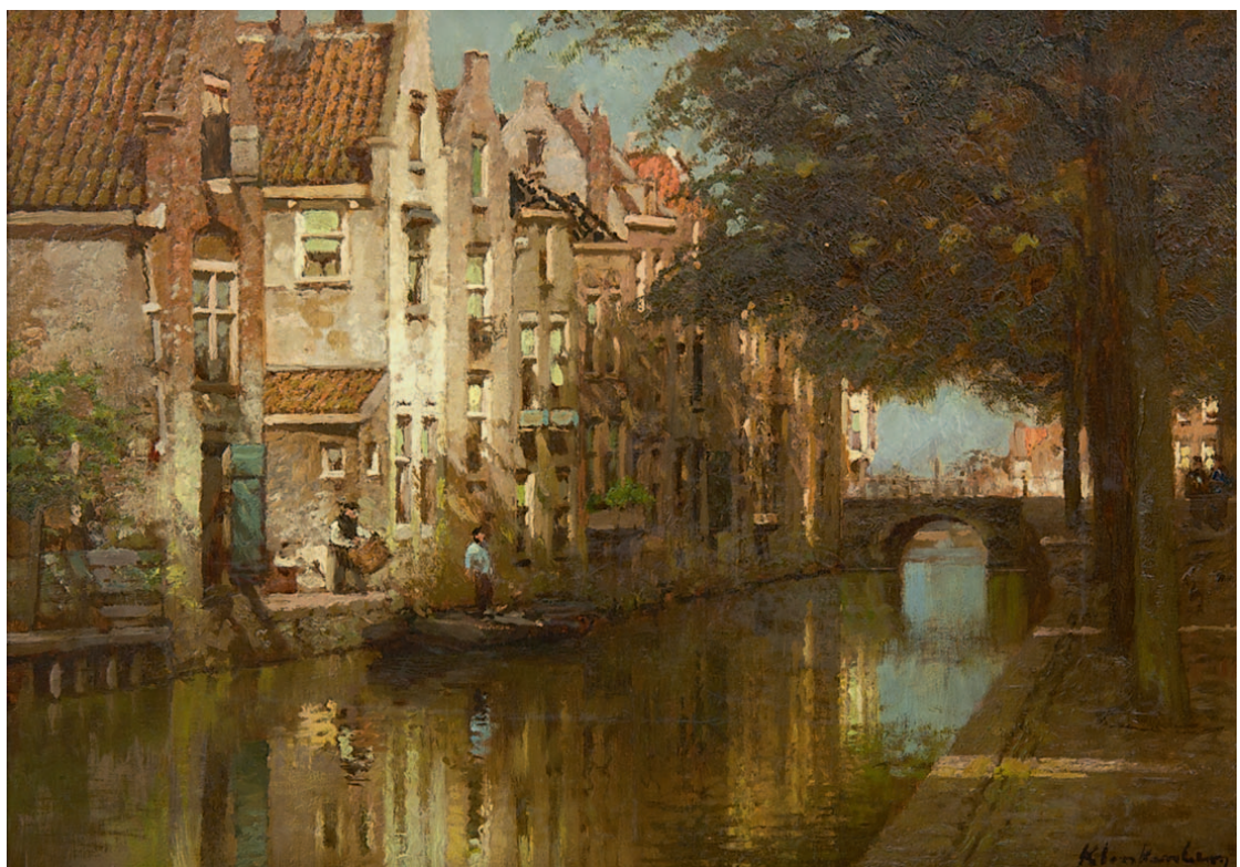
Johannes Christiaan Karel Klinkenberg Gezicht op een stadsgracht