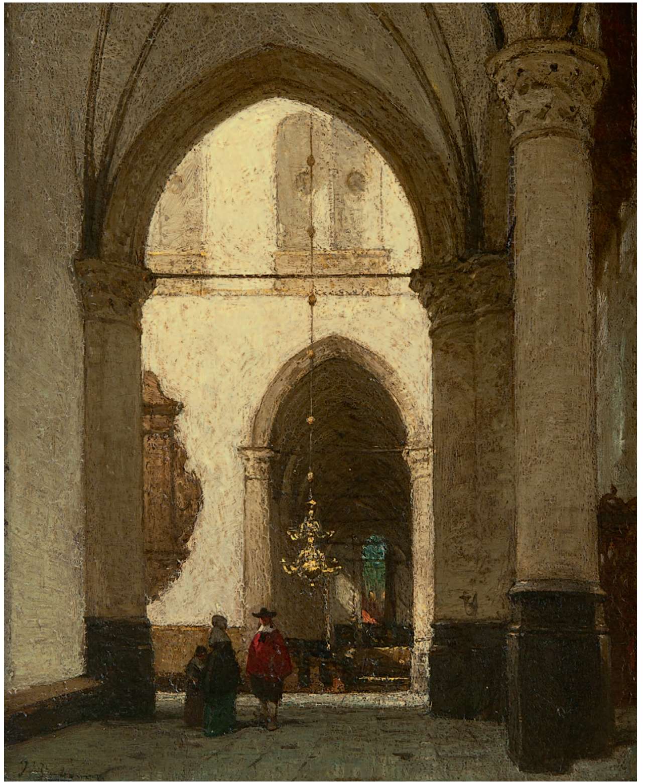
Johannes Bosboom De St. Laurenskerk, Alkmaar