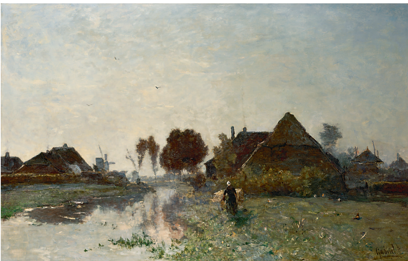
Paul Joseph Constantin 'Constan(t)' Gabriel Ochtendstemming bij Veenendaal

'Landschappen waarvan de magie alleen maar toeneemt.'