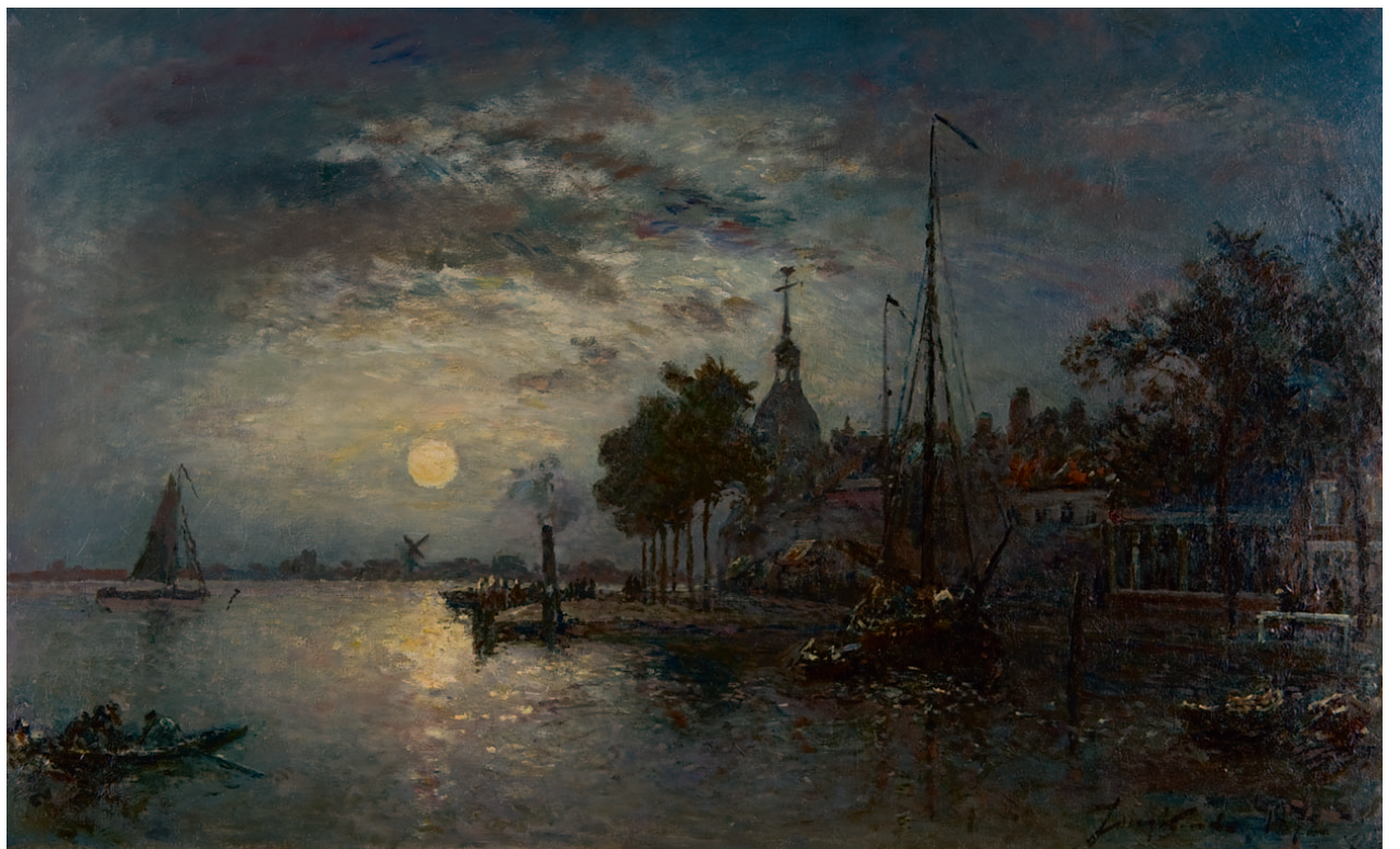
Johan Barthold Jongkind Clair de Lune, Dordrecht