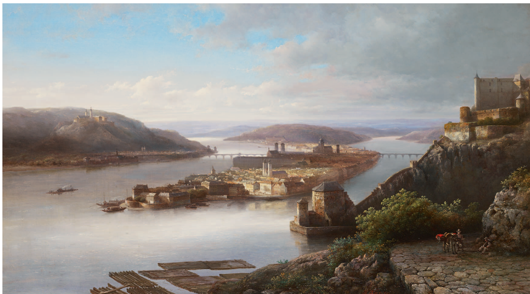
Kasparus Karsen Gezicht op Passau aan de Donau