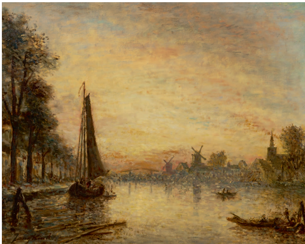
Johan Barthold Jongkind Riviergezicht bij Delfshaven