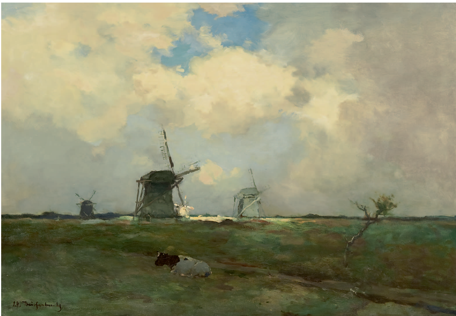
Hendrik Johannes 'J.H.' Weissenbruch Molens in een polderlandschap