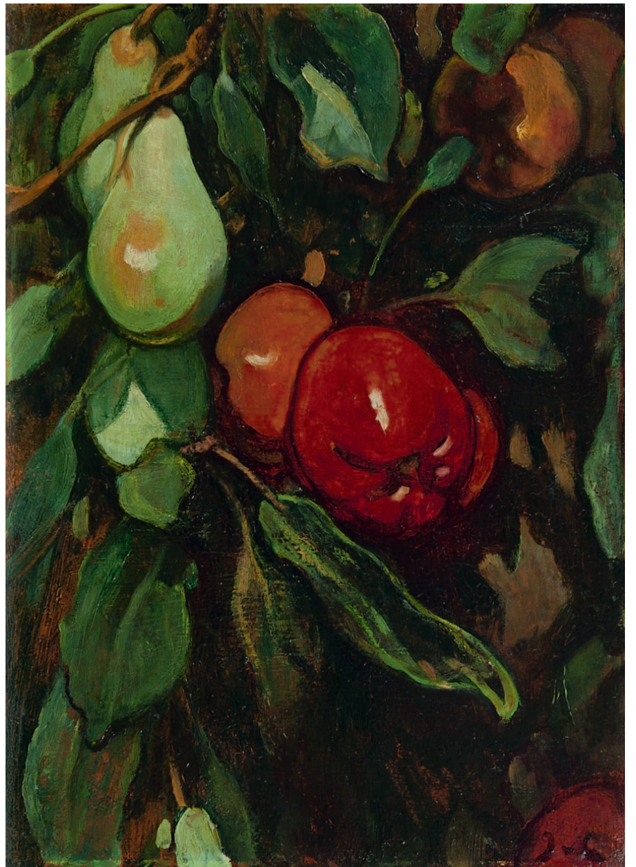
Jacobus van Looy Rode appels en peren