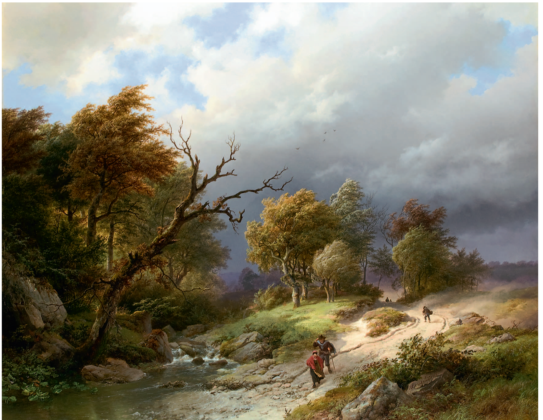
Barend Cornelis Koekkoek Opkomend noodweer

'Het klopt helemaal. Hermanus Koekkoek is niet voor niks de beste zeeschilder.'