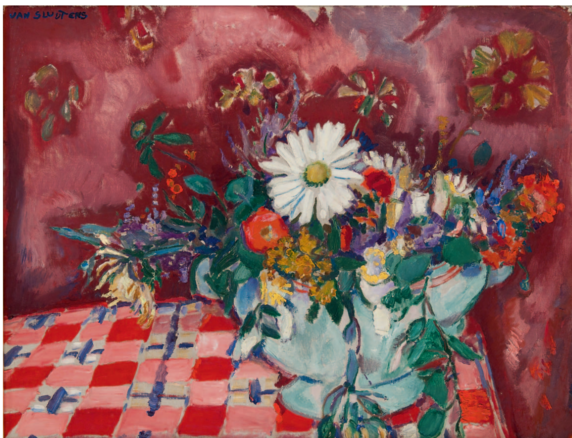
Johannes Carolus Bernardus 'Jan' Sluijters Kleurrijk boeket met margrietten

'Dit schilderij restaureerden wij in de jaren '80. Toen constateerden we dat het een dubbele signatuur had, door Sluijters zelf aangebracht. Nu, na 25 jaar, kochten we het schilderij. Voor een rustige prijs, vanwege de signatuur.'